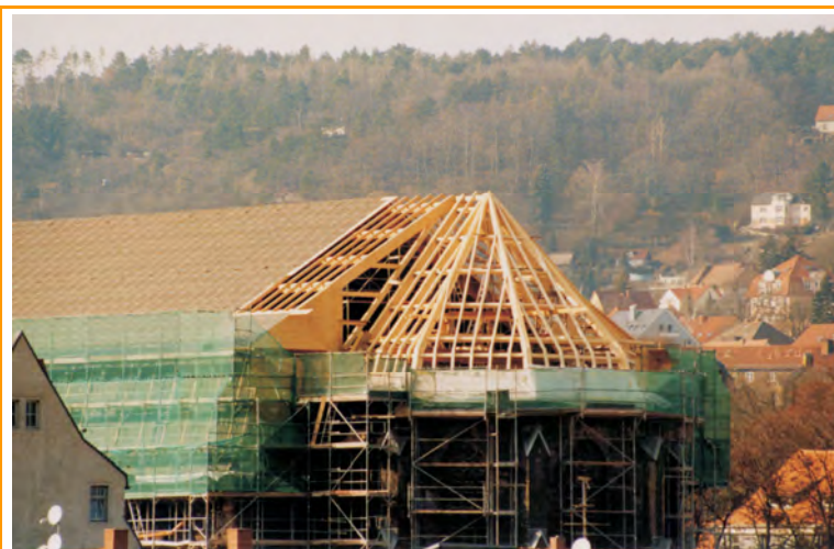
Blick auf das Chordach