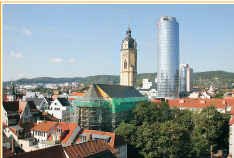
Blick von Nordosten

Neubau des Turm-, Schiff- und Chordaches Kirchplatz, 07743 Jena